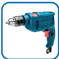
Furadeira de impacto;