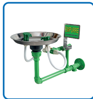
HM 020 GALVANIZADO