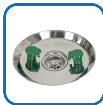
1 Cuba lava-olhos;