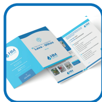
1 Manual do usuário.