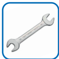
Chave fixa de 11 mm e 22 mm;