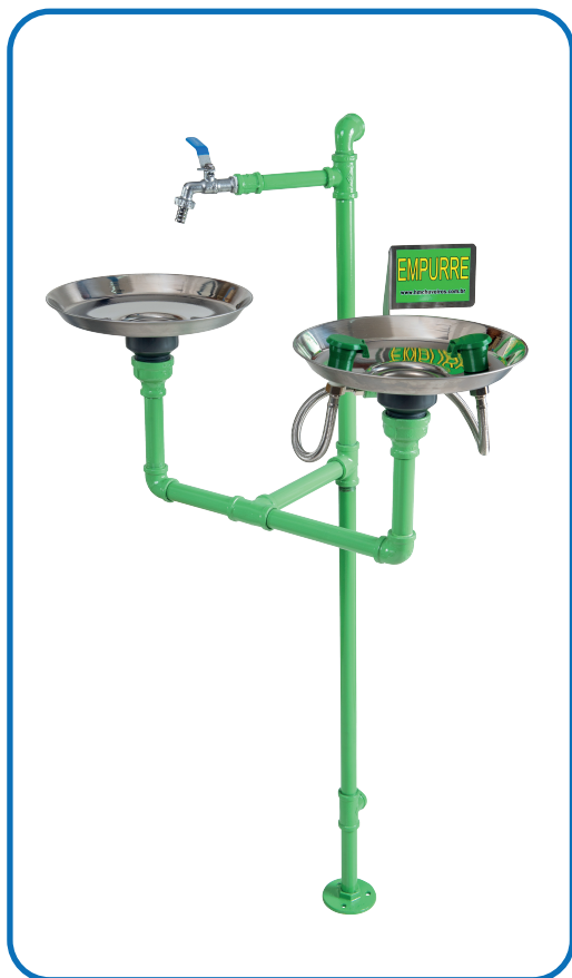
HM 070 GALVANIZADO