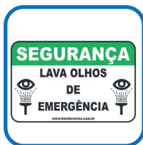
Placa de sinalização;