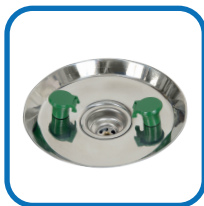
1 Cuba lava olhos;