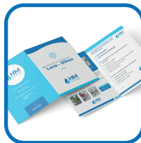
1 Manual do usuário.