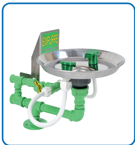
💧 HM 091 GALVANIZADO