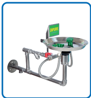
HM 060 INOX