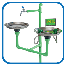
Parte central do produto com torneira.