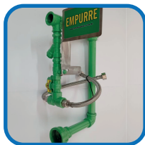
1 Cavalete completo;