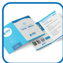
1 Manual do usuário.