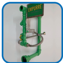
1 Cavalete completo;