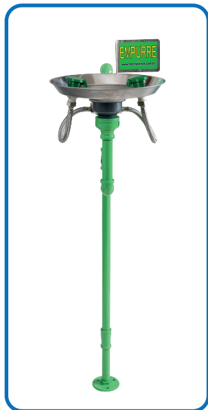
HM 050 GALVANIZADO e INOX