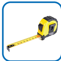
Fita métrica ou trena;