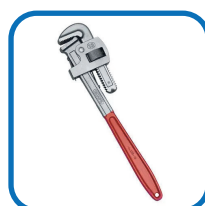
Chave de grifo;