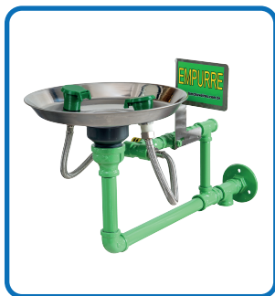
HM 060 GALVANIZADO