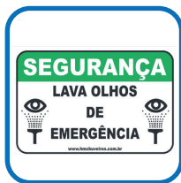
1 Placa de sinalização 30 x 21 cm;