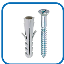
Parafuso e buchas;