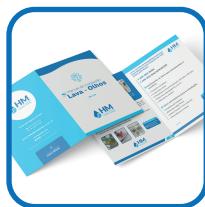
1 Manual do usuário.