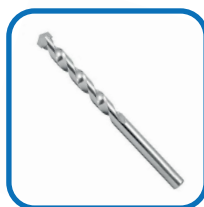
Broca de videa 10 mm;