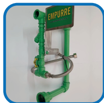
1 Cavalete completo;